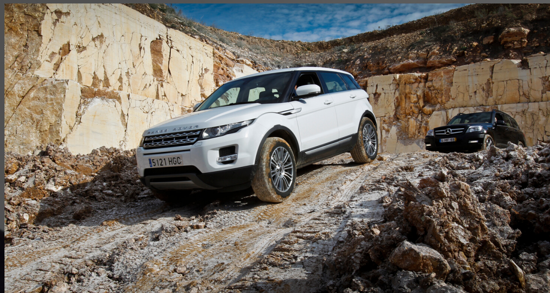
IVTM PARA VEHÍCULOS DE ALTA GAMA