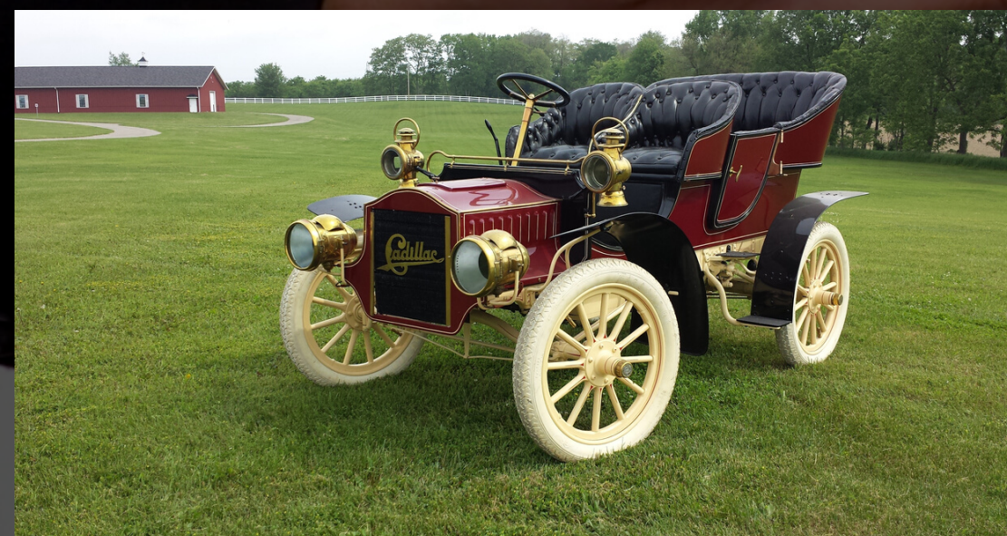
IVTM PARA VEHÍCULOS HISTÓRICOS