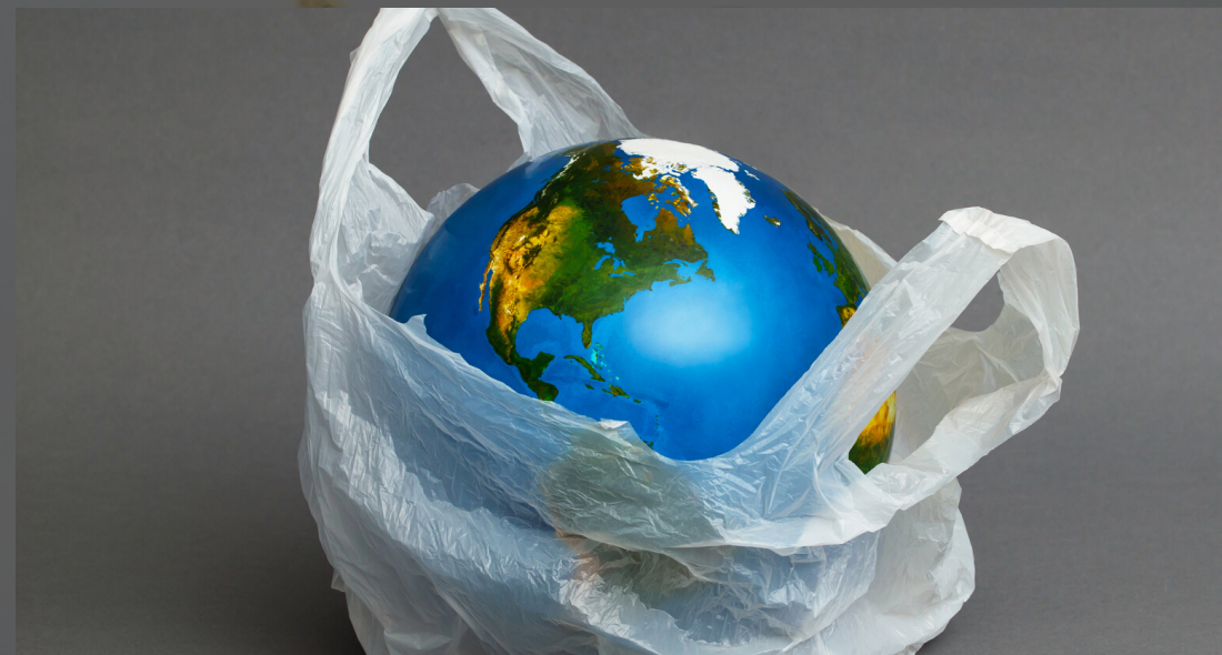
IVTM PARA VEHÍCULOS CONTAMINANTES