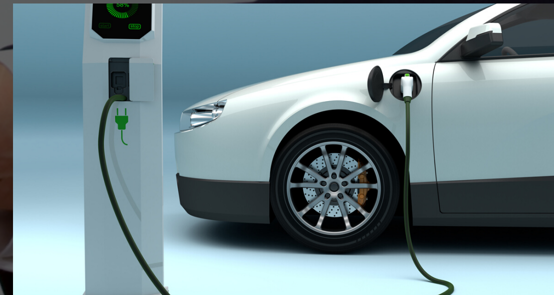
IVTM PARA VEHÍCULOS ELÉCTRICOS